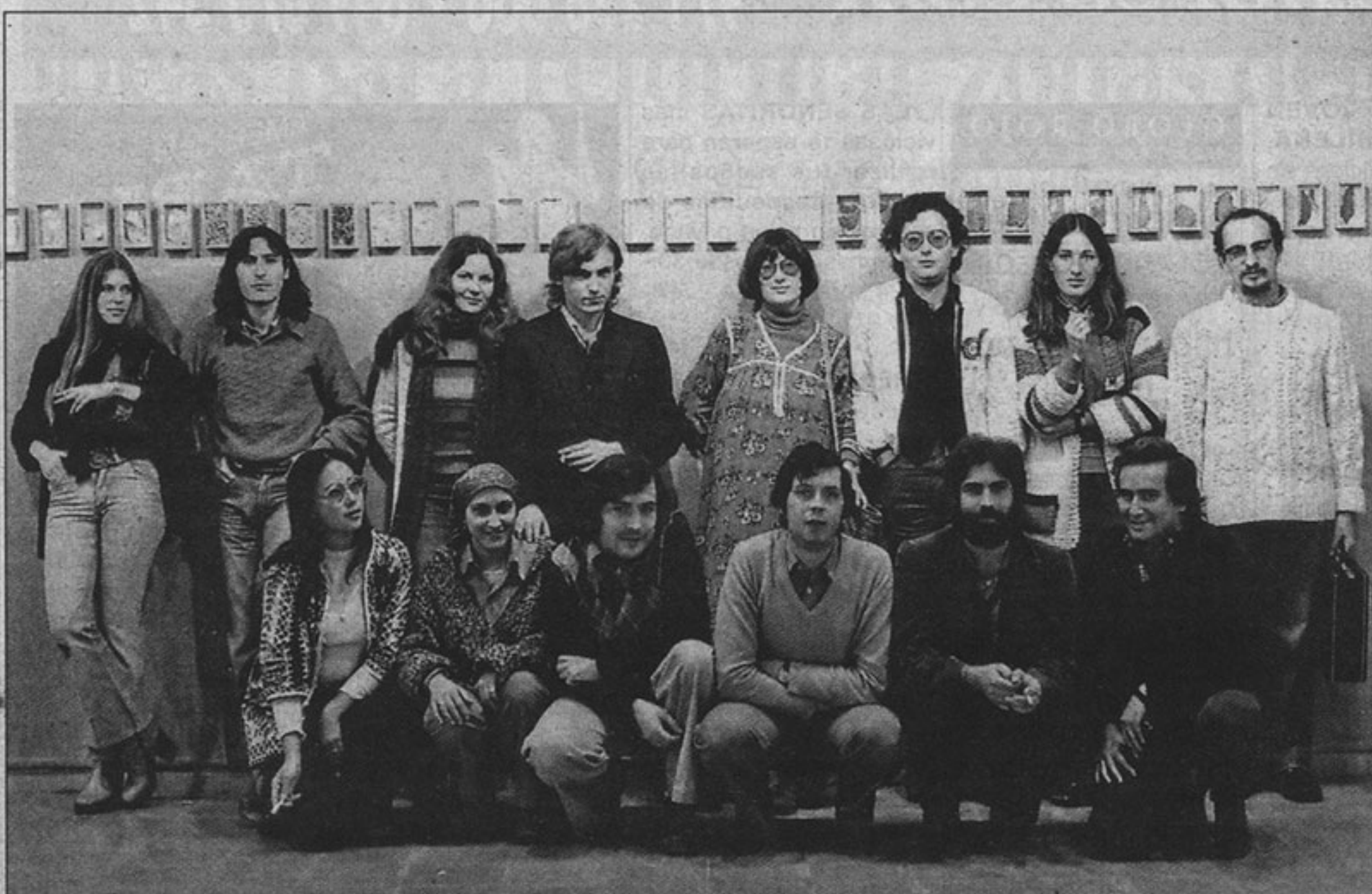
Barceló y Albertí entre algunos colegas y creadores en la exposición 'Cadaverina 15'.