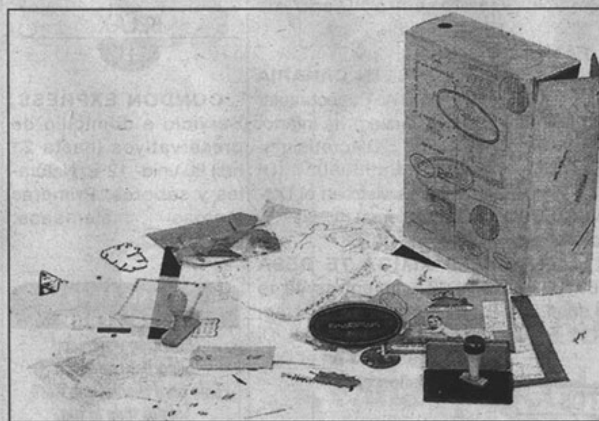
Ejemplar de la publicación setentera llamada 'Èczema'.